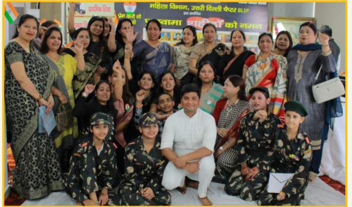
पुलवामा अमर शहीदों का सम्मान उत्तरी दिल्ली चैप्टर