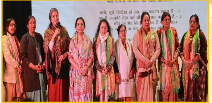
रामायणम कार्यक्रम दक्षिणी दिल्ली चैप्टर