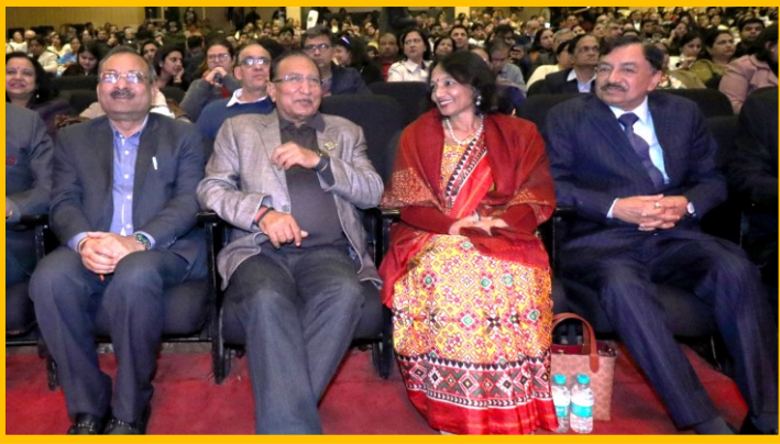
हमारे राम कार्यक्रम पूर्वी दिल्ली चैप्टर