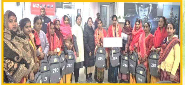
आचार्य सम्मान समारोह कानपुर चैप्टर