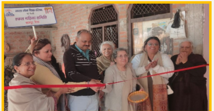
सिलाई सेंटर उद्घाटन कानपुर चैप्टर