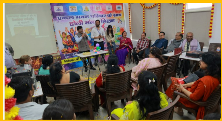
होली मिलन कार्यक्रम, BLSP, EGF, SHSS, Ekal Bharat