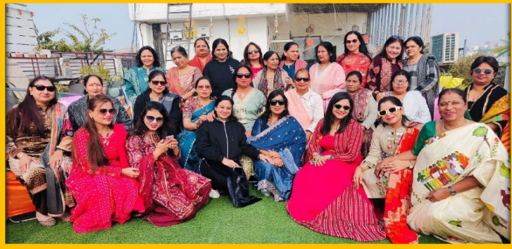
मकर संक्रांति उत्तरी दिल्ली चैप्टर