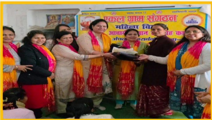
आचार्य सम्मान समारोह लखनऊ चैप्टर