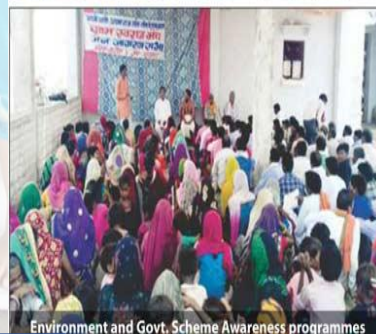
Environment and Govt. Scheme Awareness programmes