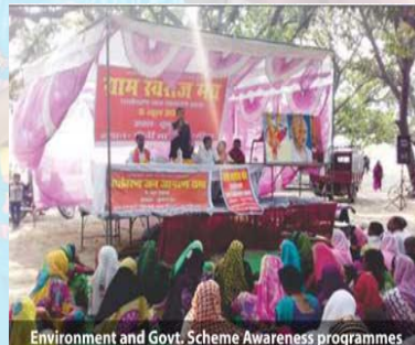
Environment and Govt. Scheme Awareness programmes