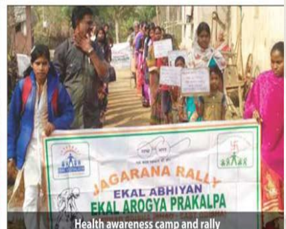
Health awareness camp and rally