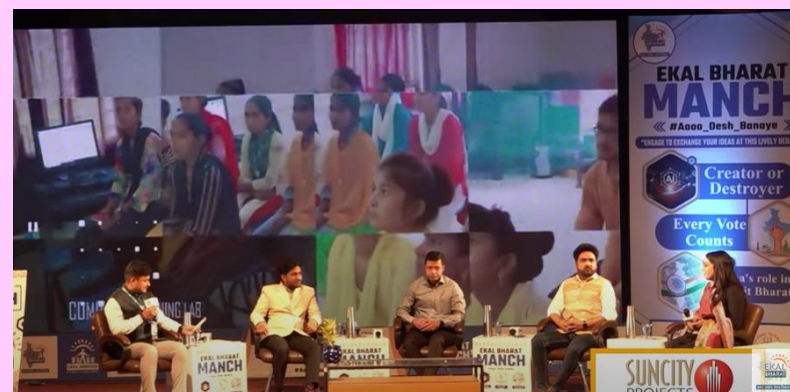
BLSP एकल युवा दिल्ली द्वारा आयोजित कार्यक्रम