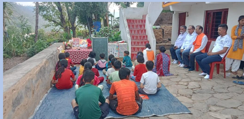
पूर्वी दिल्ली चैप्टर द्वारा उत्तराखंड संभाग के अल्मोड़ा अंचल में समन्वय बैठक (30 जून 2024)