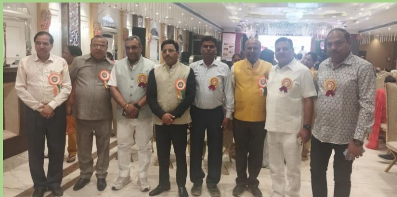
उत्तरी दिल्ली चैप्टर द्वारा दानदाता सम्मान समरोह (5 अप्रैल 2024 पीतमपुरा, दिल्ली)