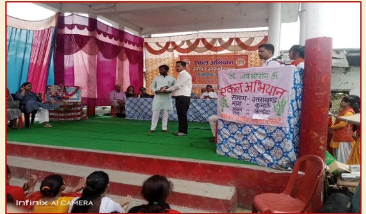
कार्यकर्ताओं का सम्मान करते हुए

एकल विद्यालय में प्राथमिक शिक्षा के साथ-साथ आरोग्य, विकास, स्वाभिमान, जागरण तथा संस्कार शिक्षा देने का कार्य किया जा रहा है। जिसको सीधे हम वनयात्रा के माध्यम से देख सकते हैं और उसकी क्रियाविधि को भी समझ सकते हैं। गांव में पहुंचते ही ग्रामीणों ने फूल माला पहनाकर सभी वनयात्रियों का स्वागत किया। ग्रामीणों के प्यार से अभिभूत होकर सभी का हृदय आनंदित हो गया। एकल विद्यालय का दर्शन किया गया।