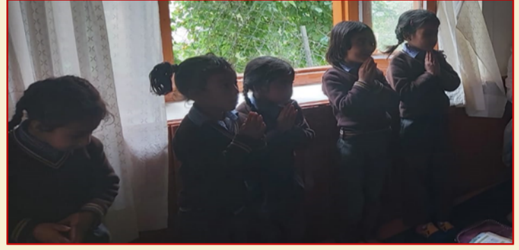
लेह में संचालित एकल विद्यालय के बच्चे वनयात्रियों को प्रार्थना सुनाते हुए