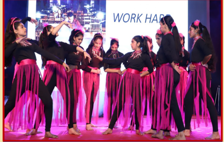
विवेकानंद स्कूल के बच्चे प्रस्तुति देते हुए