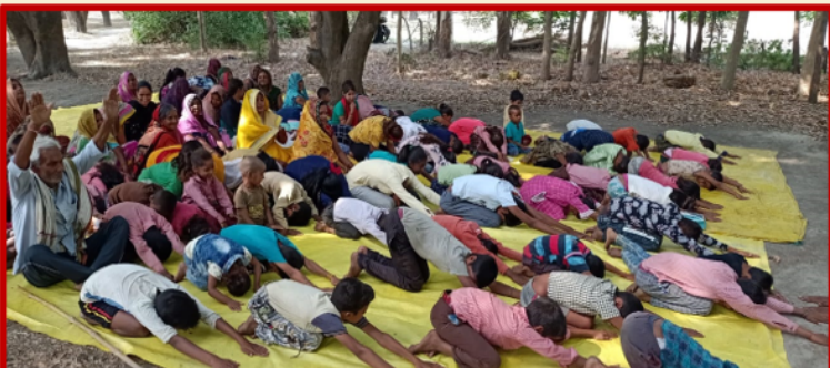
योगा करते हुए एकल विद्यालय के बच्चे