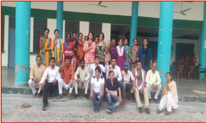
वनयात्री एवं कार्यकर्ताओं के सामूहिक छायाचित्र