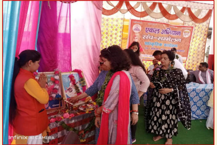
दीप प्रज्वलन करके कार्यक्रम की शुरुवात करते हुए