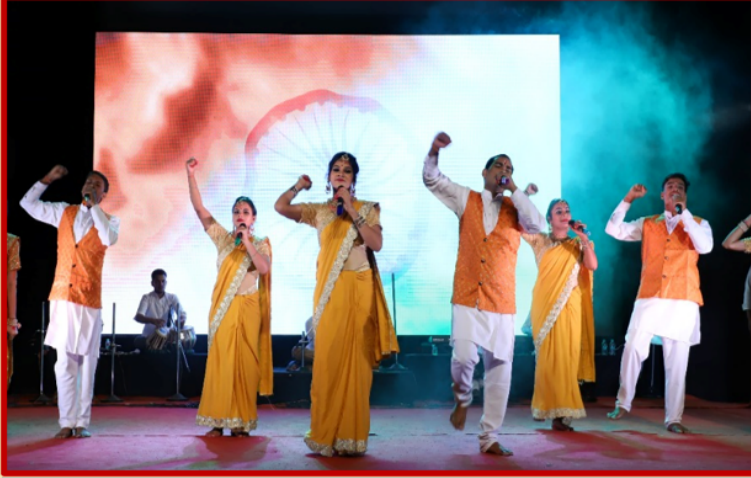
एकल सुर ताल की टीम देशभक्ति गीत प्रस्तुत करते हुए