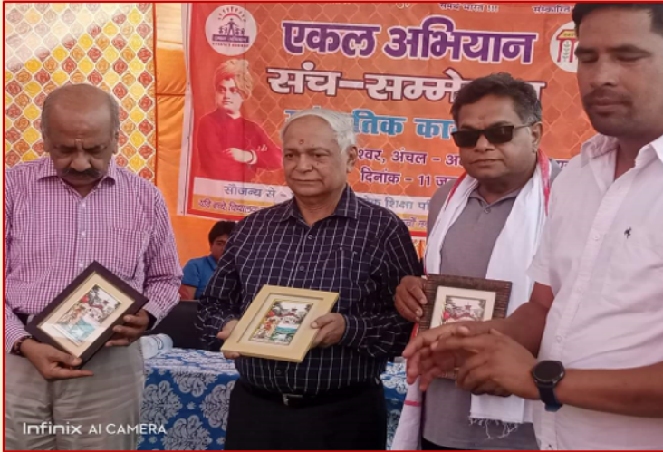
संच के वार्षिक उत्सव में भाग लेते हुए पदाधिकारी