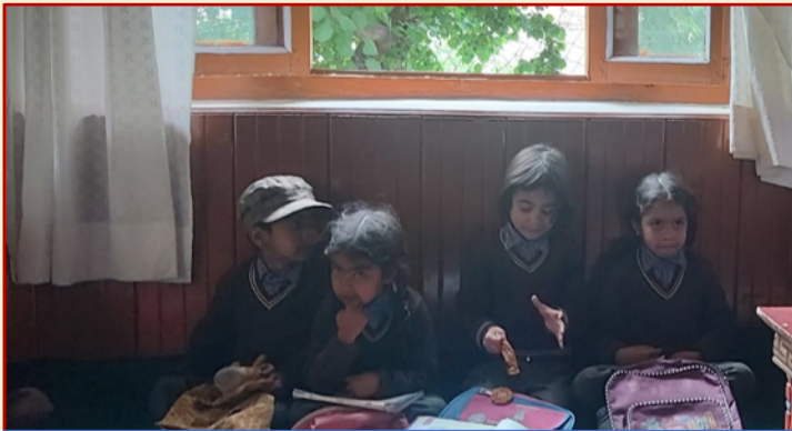
एकल विद्यालय के बच्चे कविता सुनाते हुए