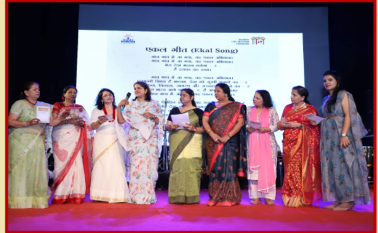
एकल गीत प्रस्तुत करते हुए राष्ट्रीय महिला समिति एवं पूर्वी दिल्ली चैप्टर की महिला समिति

एकल भारत लोक शिक्षा परिषद्, पूर्वी दिल्ली चैप्टर द्वारा विवेकानंद स्कूल एवं एकल सुर एकल ताल के टीम द्वारा सांस्कृतिक कार्यक्रम का आयोजन रविवार, 5 जून 2022 को विवेकानंद पब्लिक स्कूल, डी-ब्लॉक, आनंद विहार में किया गया। इस कार्यक्रम में लगभग 300 लोग उपस्थित रहे। इस कार्यक्रम में आये हुए कई दानवीर शिक्षा प्रेमियों का सम्मान किया गया। कई अन्य दानदाताओं ने अपने अपने सामर्थ्य के अनुसार एकल विद्यालय के लिए सहयोग किया। गांव और शहर के मध्य ऐसा अद्भुत समन्वय देखकर सबका हृदय देश प्रेम भाव से भर गया। गांव और शहर को ऐसे सांस्कृतिक कार्यक्रमों के द्वारा जोड़कर राष्ट्रीय एकता को मजबूत करने का इससे बड़ा माध्यम और कुछ नहीं हो सकता।