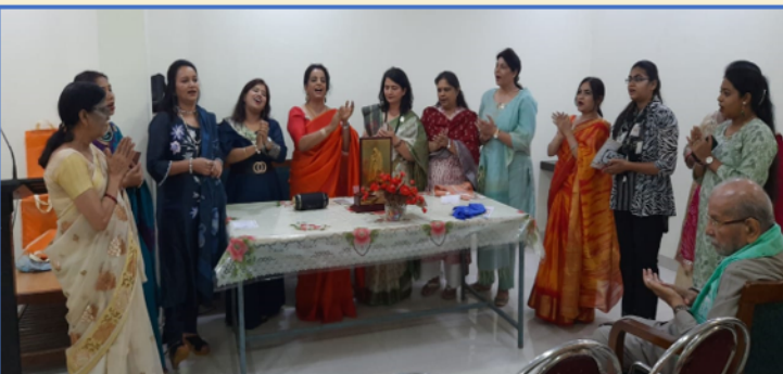
भजन गाते हुए पूर्वी दिल्ली चैप्टर, महिला समिति की टीम