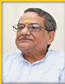
प्रणेता एवं संस्थापक सदस्य